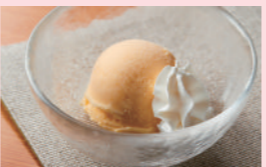
アイスクリーム [バニラ/宇治抹茶/チョコ]