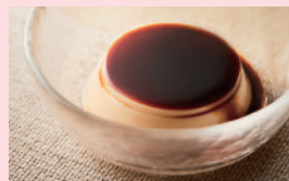
なめらか和プリン [黒蜜ソース]